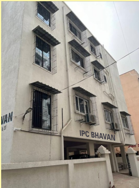
Office cum Church Building