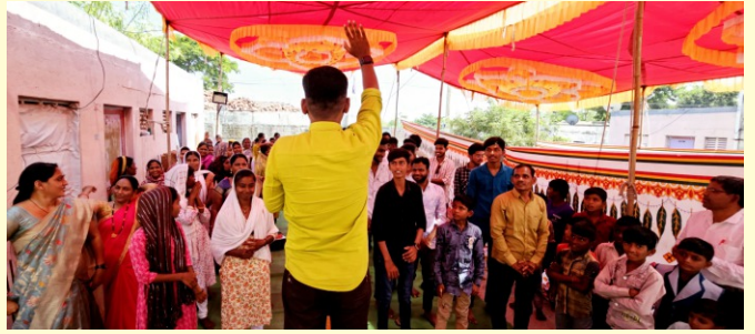
Youth Seminar at Beed