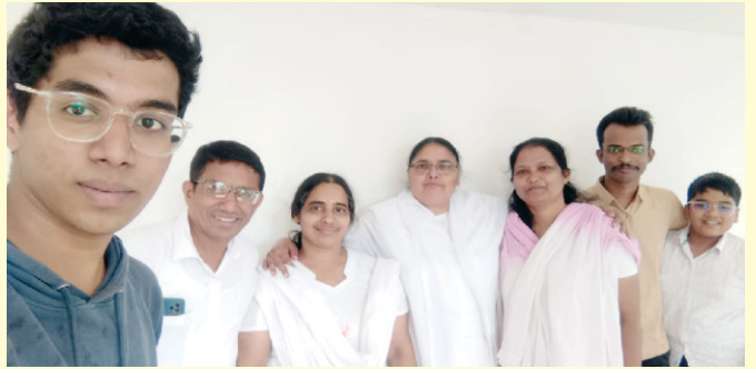
From a Gospel Meeting at Nanded