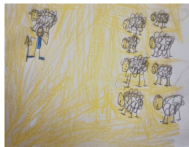
The lost sheep