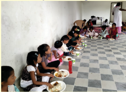
Food for all