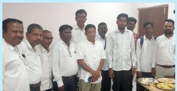
Some of our Youth Leaders