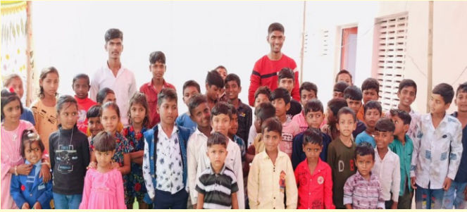
Sunday School children at Beed