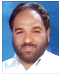
പാസ്റ്റർ സങ്കി പിച്ചി.

ഇന്നെല്ലാ കയ്യിലും ടാബ്ലെറ്റാണ് ടാബ്ലെറ്റില്ലാത്ത ജീവിതം മിഥരെ സങ്കല്പിക്കാനാവുന്നില്ല.